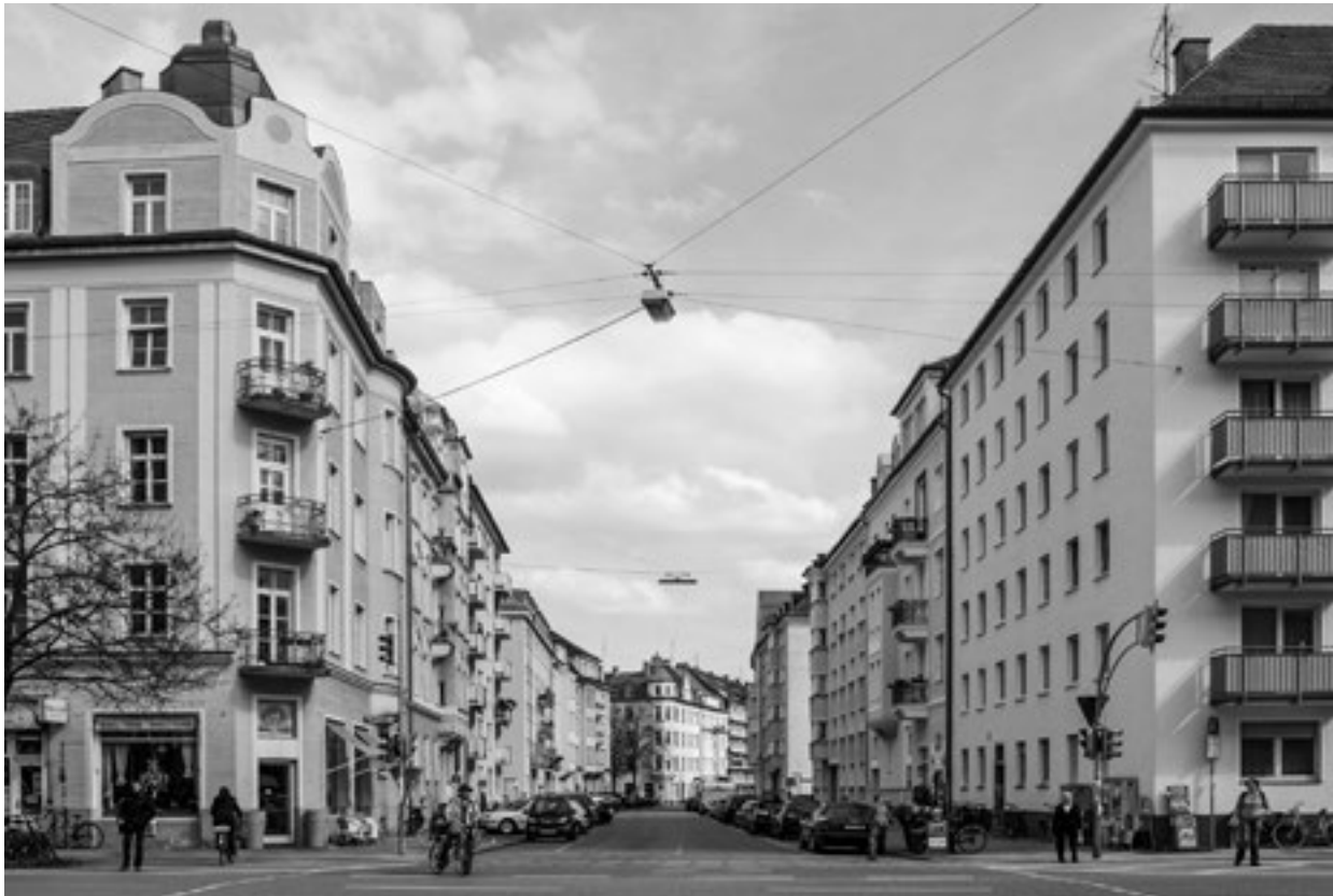
Der Blick in die Georgenstrasse, heutige Situation, zeigt die erhaltene räumliche Festlegung nach der Planung Theodor Fischers.

so eine selbstverständliche Einbettung der neuen Stadt in das Gelände. Ausserdem wechselt, in einem praktisch vollständig und meist kleinteilig parzellierten Land, am Weg die Parzelle, sodass bei einer Verbreiterung der Wege zu Strassen die einzelne Parzelle nicht zerschnitten, sondern nur vom Rand her belastet wird (Strassenmitte = alte Grundstücksgrenze) und dadurch in der Nutzung weniger gestört wird. Dies bedeutet auch, dass durch die Neuanlage nicht ein einzelner Eigentümer, sondern jeweils die Nachbarn gleichmässig an den Rändern der Grundstücke belastet werden, was eine wesentlich höhere Akzeptanz des Eingriffs in das Grundstückseigentum erwarten lässt – ein praktischer Kompromiss auf Grundlage bestehender Verhältnisse.