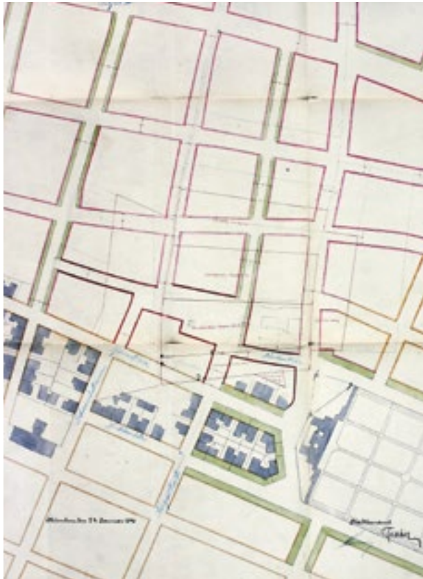
Georgenstrasse: nahtloser Übergang zur Stadterweiterung.

(Wohnstrassen) abzweigen. So gliederte sich das Bauliniennetz in Strassen für den Verkehr und Strassen für das Wohnen. Diese Dichtefestlegung war grundsätzlich unabhängig von der Entfernung vom Zentrum. So konnten auch vom Zentrum entfernt dezentrale Plätze mit höherer Umgebungsbebauung angelegt und besondere Orte und Plätze mit entsprechend passender Rahmung der Bebauung einfach definiert werden.