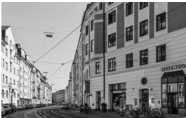
Blick in die Hohenzollernstrasse, heutige Situation.

Im Ergebnis spiegelt nun der öffentliche Raum einerseits die zugrunde liegende Parzellierung und Topografie wider, andererseits ist es eine Konzeption des Stadtraums, bei der «Mannigfaltigkeit» und dennoch Einheit durch Unter- und Überordnung («nur einer soll herrschen, nichts ist's mit der Vielherrschaft») erzeugt wird – Stadt als Formidee mit dem Ziel der Geschlossenheit des ästhetischen Eindrucks.